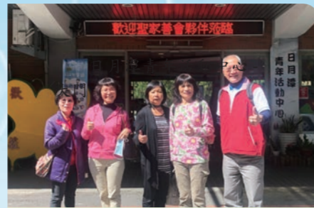
日月潭青年活動中心 - 大門