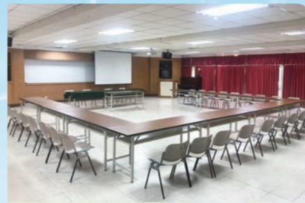
日月潭青年活動中心 - 會議廳