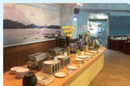
日月潭青年活動中心 - 早餐廳